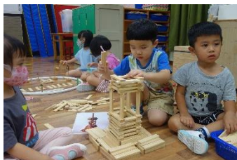
▲ 和同學合作、互相學習蓋出積木作品