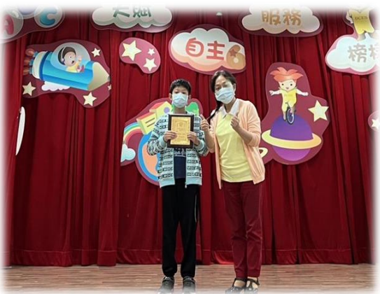
▲小陽的努力獲選了道德小公民的殊榮