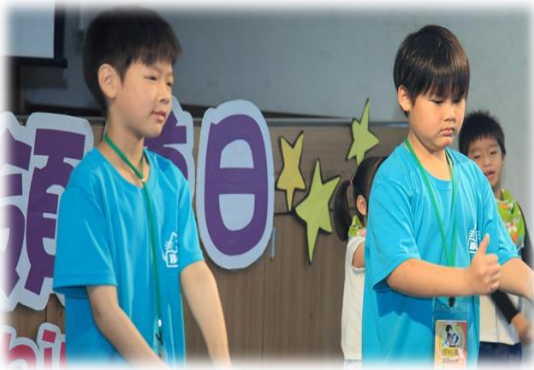
▲擔任天賦展能才藝秀的退場 歌曲領唱領導人