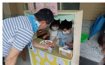
▲ 提供機會與情境讓孩子練習與他人互動