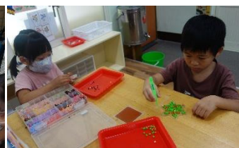
▲ 小手和小拼豆耐心組成大作品