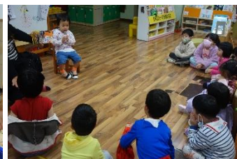
▲ 鼓起勇氣，準備故事說給全班同學聽