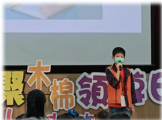
▲小陽於領導日時和在座的來賓與家長分享自己的成長

小陽總是認真完成分內的每一件事，並勇於挑戰自己。現在的小陽，已能站在全校面前，透過麥克風，用他清晰的嗓音和全校師生分享他一路以來的成長。小陽就是全校師生最佳的學習模範，期待他能持續的挑戰自己、相信自己，突破更多人生的關卡！