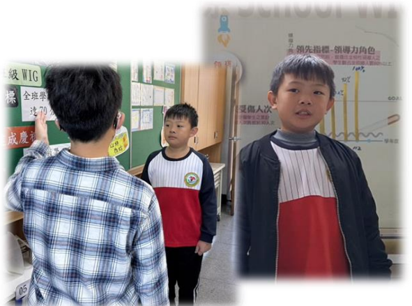
▲ 引導同學介紹的內容及嘗試擔任學校重要 WIGs 定點導覽員