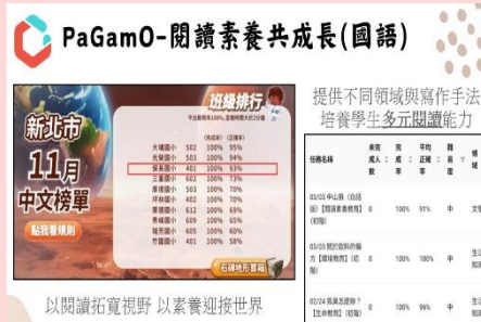
運用 PaGamO 提升閱讀能力