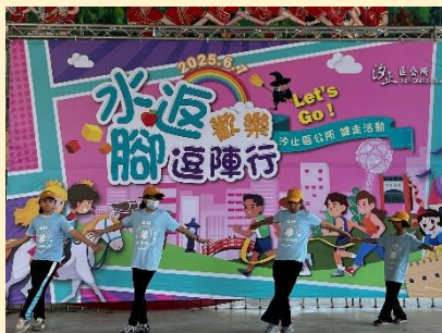
學生參與地方活動展現舞蹈才藝