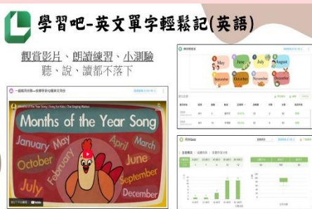
運用學習吧進行英文朗讀教學