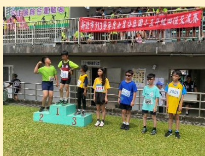
五年級田徑賽學生成績優異