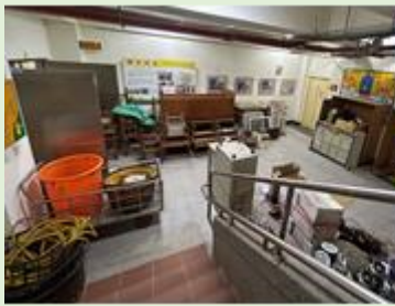
*空間合理運用-報廢物品清運/檔案室文件銷毀