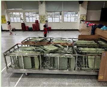
*樂活館鐵製折椅全面更新為黑色塑鋼折椅