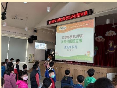
校長宣導友善校園愛護彼此