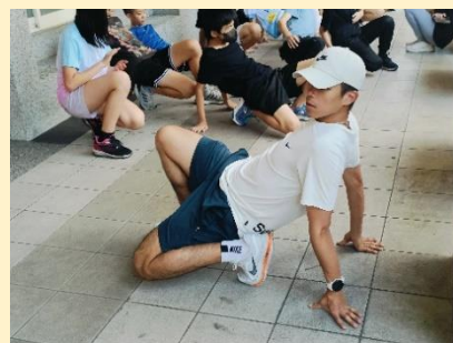
聘請專業教練發展終身運動習慣