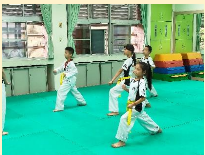
增加運動社團增強運動技能