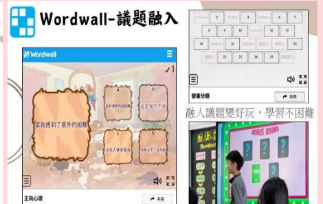
運用 Wordwall 從遊戲中學習