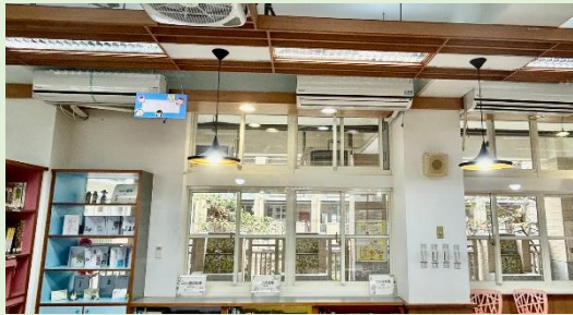
*圖書館增設冷氣/隔簾(暑假)