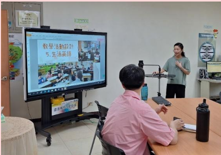
說課-教師會議辦理公開說課