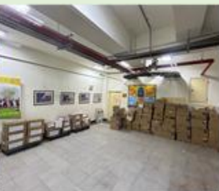
*工具室空間重新規畫整理