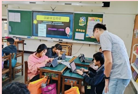
觀課-設計科技輔助學習的課程