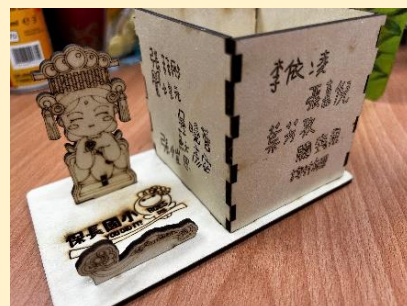
應援上上籤品德*關懷*雷雕講座