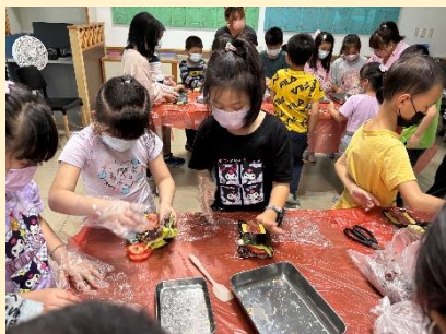
辦理多元講座協助學生自我探索