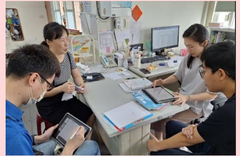
觀課-利用下課時間進行議課