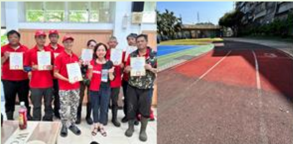
*持續引入社區資源補充人力缺口(攸惜關懷基金會、永慶房屋)