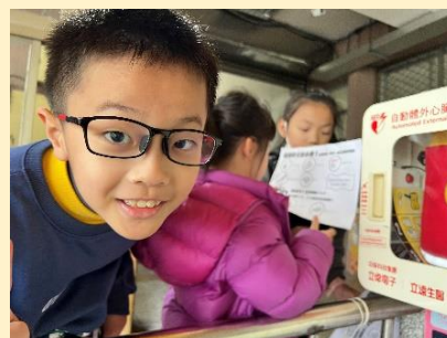
校園防災定向闖關活動