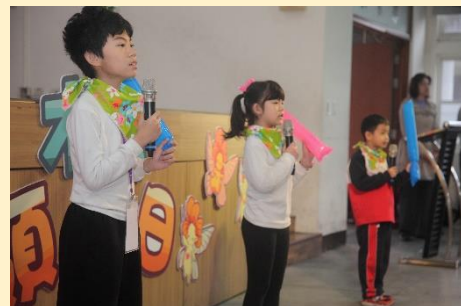
學生擔任領導日各項服務工作