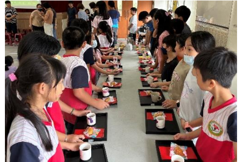
▲ 奉茶領導人奉上點心及飲品

9 月 23 日，保長國小學生燈塔舉辦了一場溫馨感人的教師節敬師活動，旨在向老師們表達誠摯的感謝與祝福。今年的活動內容包括以下四項：