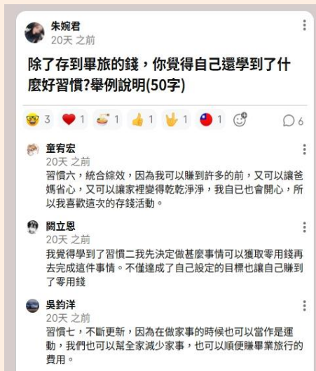
圖 1 學習收穫與好習慣分享

五忠教室裡流傳著一張特別的「契約」，那是通往畢業旅行的夢想票券。本學期親師生共同推動「理財小達人：家庭情感帳戶與畢旅儲蓄計畫」。起初面對 6000 元費用，孩子們難免猶豫，但透過「以終為始」，將目標拆解為半年存下 3000 元，逐步建立信心。過程中，孩子們學會主動分擔家務、創造價值，也更能體會父母辛勞；同時以關懷累積情感帳戶，讓家庭更加溫暖。再加上全家共同規劃開支、穩定儲蓄，這段歷程不僅培養理財能力，也凝聚親子情感。