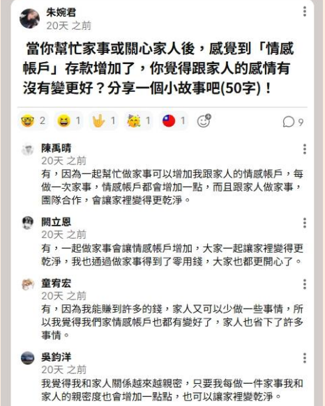
圖 2 情感帳戶與家庭互動分享