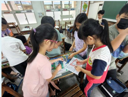
圖 3 下課自學互助時光

鐘聲響起，班上的女孩們仍埋首書寫，刷刷聲在教室迴盪，其間夾雜著「這題你會嗎？」的討論。她們一邊完成作業，一邊互相請教；有疑問時主動詢問老師，再回座分享。還不到放學，繳交區已整齊疊滿作業本。回家後，她們也能自主安排時間，閱讀、遊戲或創作都能兼顧。這樣的日常，正體現七個習慣的精神：以終為始規劃時間，運用雙贏思維互助學習，在合作中統合綜效，並持續練習不斷更新自我。女孩們不只是完成作業，更在生活中展現自律與合作，讓學習自然發生。