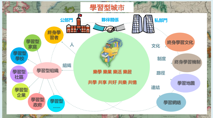
圖 1 建構學習型城市

新北市政府為優化資訊近便性，耗費巨資建置「新北市學習地圖」，確保市民能公開且即時獲取全市 29 鄉鎮市共 22 類 805 個終身學習機構的各項學習資訊。為便於市民挑選自己想要的課程並熟練簡易操作技巧，今年欲於汐止、泰山、三重、三