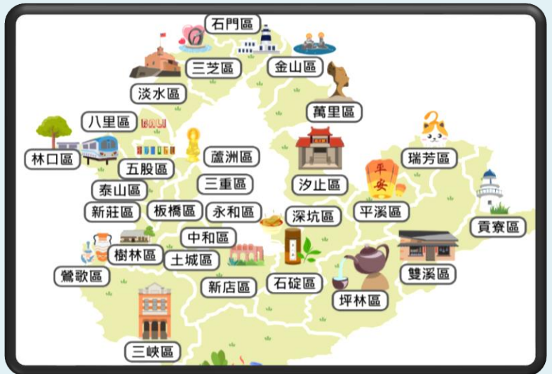
圖 3 新北市 29 區學習地圖

您想成為一位利人利己的「終身學習諮詢師」嗎？歡迎您踴躍報名參加學校於3月25日(星期三)在汐止大同分館(忠順廟旁)舉辦的初階培訓及4月22日(星期三)的進階研習，日後還規劃更豐富的精進課程及參訪活動，將會帶給您更遼闊的視野及更亮麗多彩的奇幻人生哦！