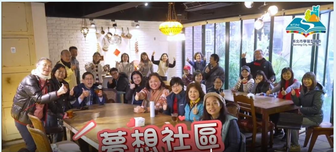
圖 1 學習型商鋪參訪夢想社區

※有意參加者請填寫報名表，於3月20日前由貴子弟交回給導師，如有任何問題請逕洽黃鈺樺校長（電話：86482502 分機 100 或 0955573636），感謝您！