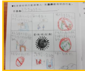
拍攝自二孝趙祐婕寒作

感謝保長孩子的分享與實踐，也希望我們每個人對於環保行動都能有所作為，讓我們愛的地球平安又健康。